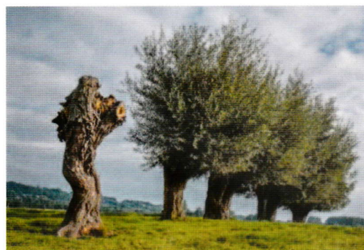
Taille des saules en têtard